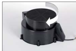
Montowanie filtra węglowego